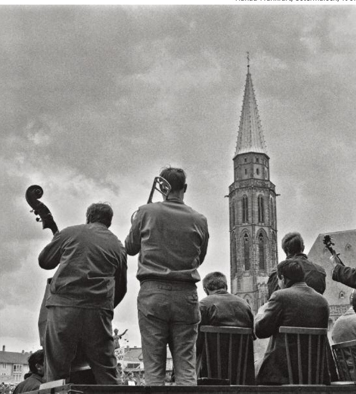
Hanau-Frankfurt, Ostermarsch, 1967