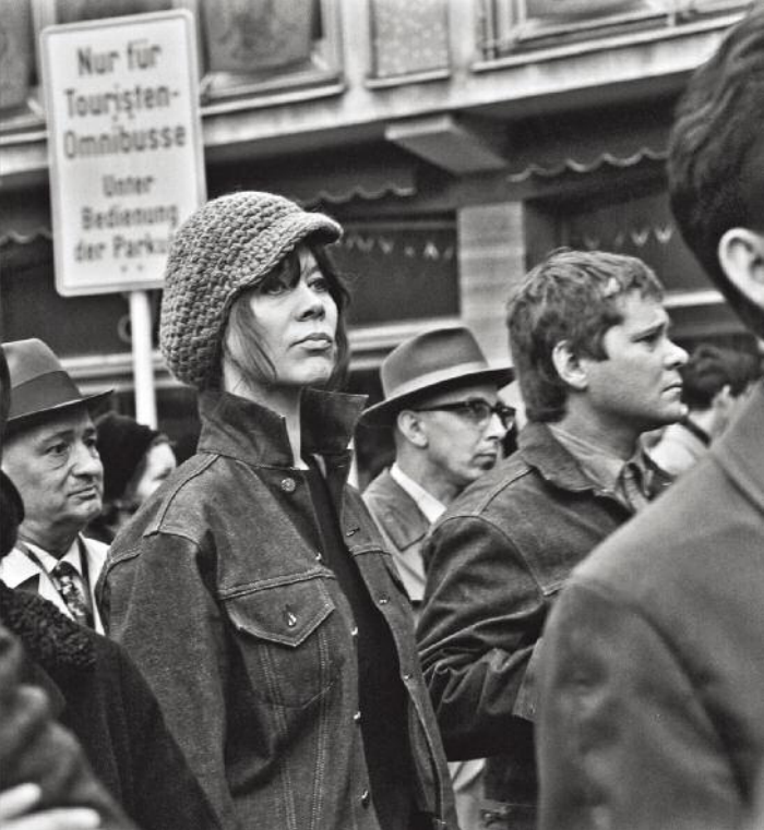
Hanau-Frankfurt, Ostermarsch, 1967